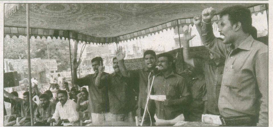
பாளை ஜவஹர் திடலில் ஆதிதமிழர் பேரவையினர் கோரிக்கைகளை வலியுறுத்தி ஆர்ப்பாட்டம் செய்தனர். திடுழ் இந்த — இல்லை — இல்லே —